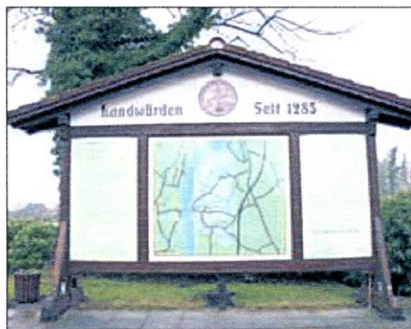
Am Markthamm steht dieser Schaukasten. Er wurde ebenfalls vom Bürgerverein bezahlt und bietet unzählige Informationen über Landwürden.

Und gerade erst kürzlich wurde ein Bronzschwein am Markthamm aufgestellt, um an den Schweinemarkt zu erinnern.